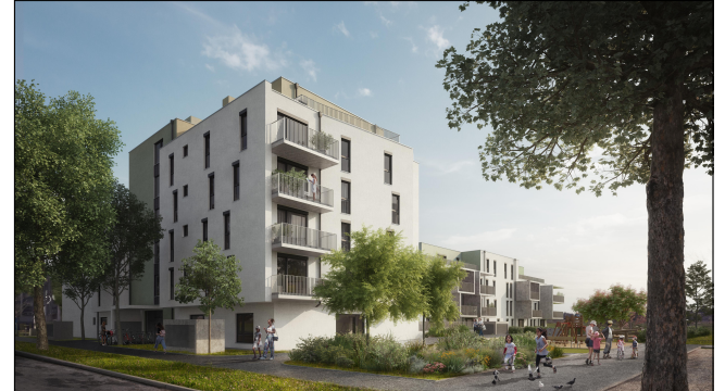
Übersicht (ohne Maßstab)