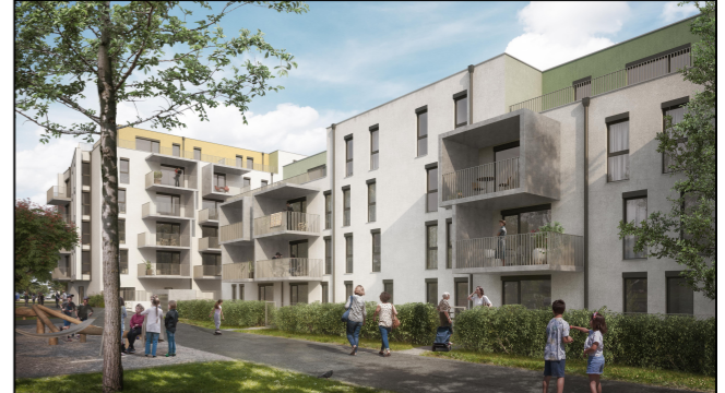
Übersicht (ohne Maßstab)

Top27 Groß-Enzersdorfer Str. 74 1220 Wien