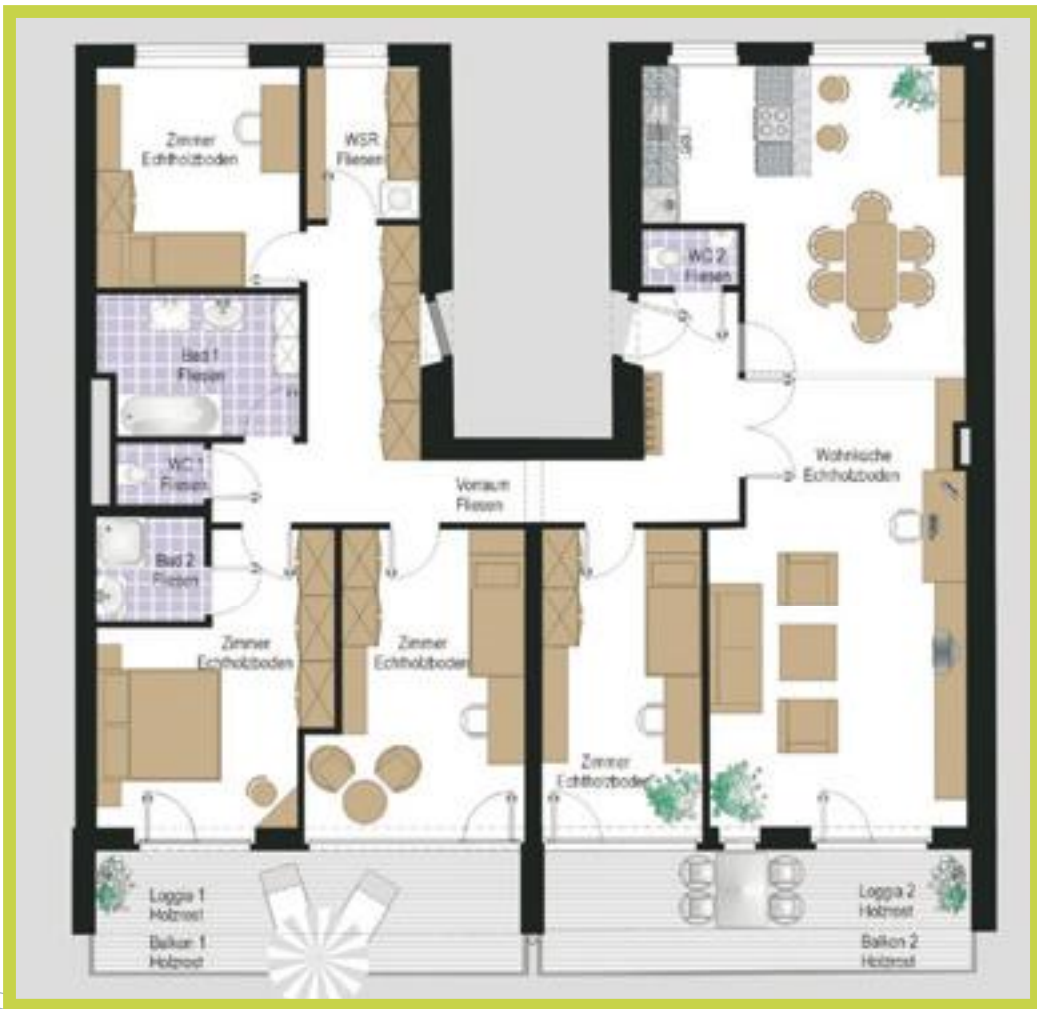
Repräsentative 5-Zimmer-Wohnung Wohnfläche: 140 m 2