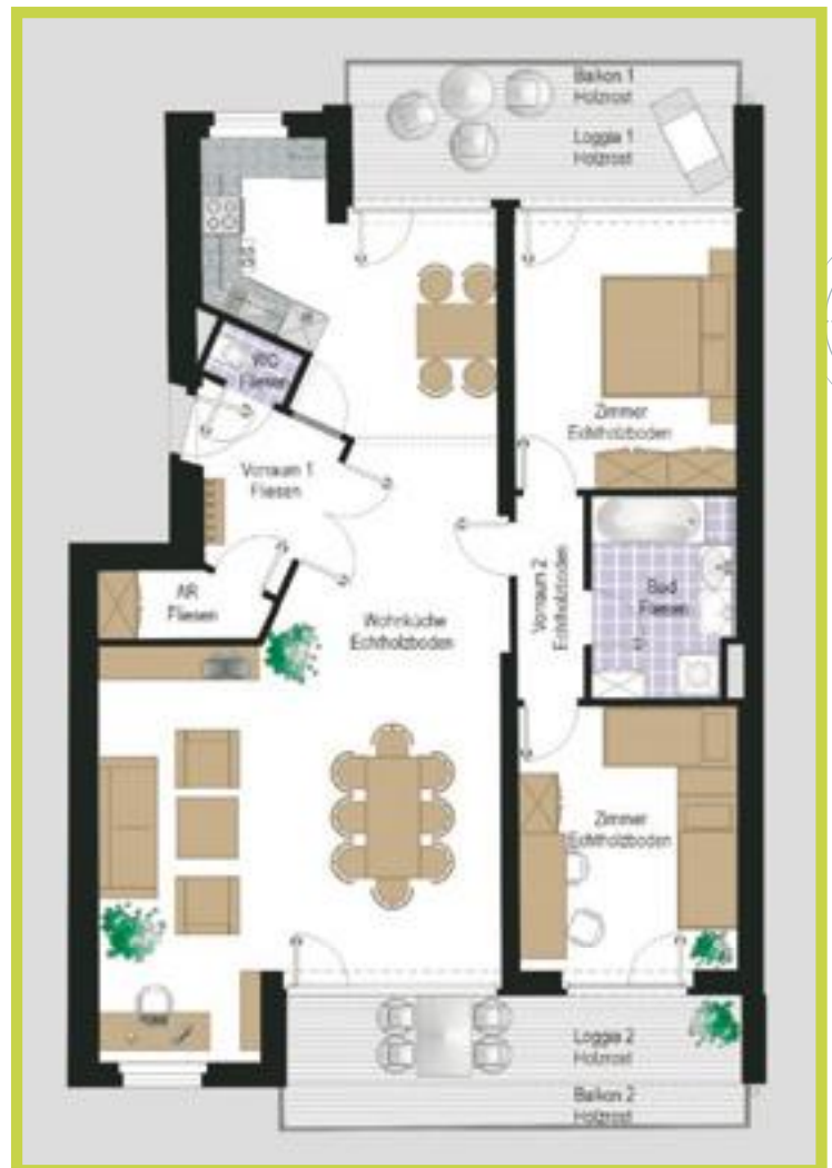
Großzügige 3-Zimmer-Wohnung Wohnfläche: 98 m 2