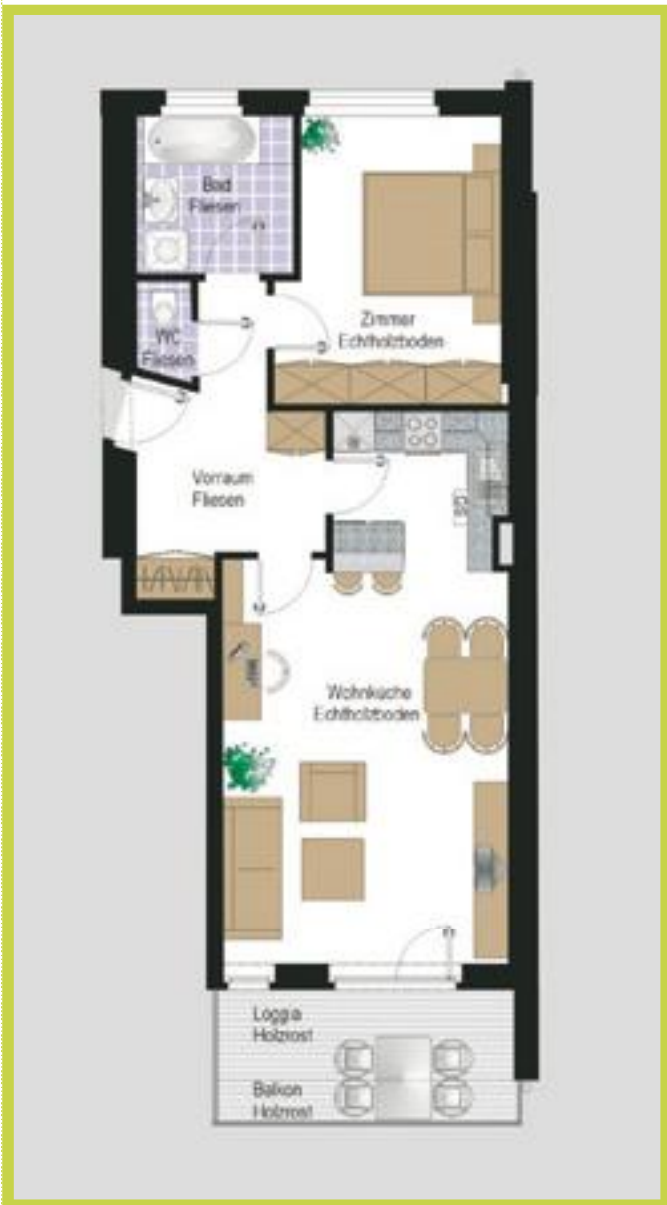
Ideale 2-Zimmer-Wohnung Wohnfläche: 57 m 2