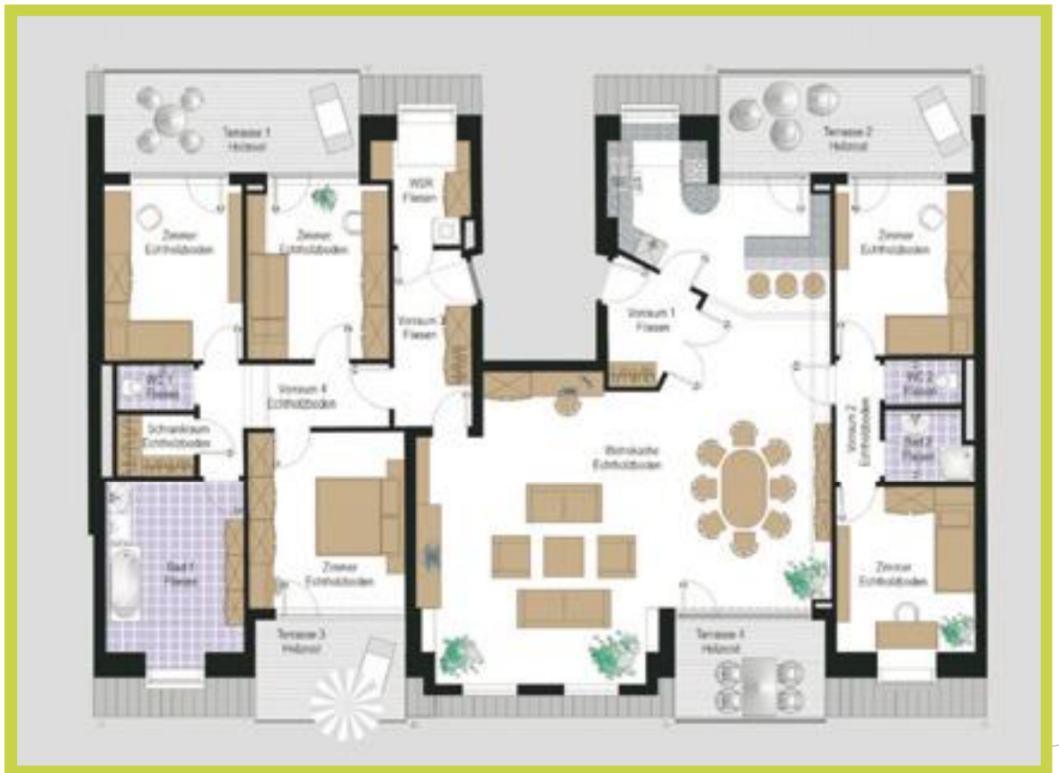
Penthouse Wohnfläche: 200 m 2